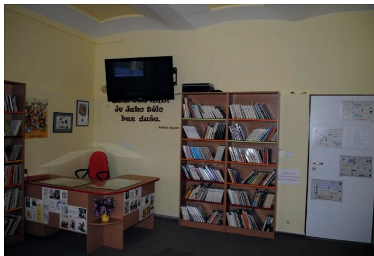
Knihovna, relaxační místnost