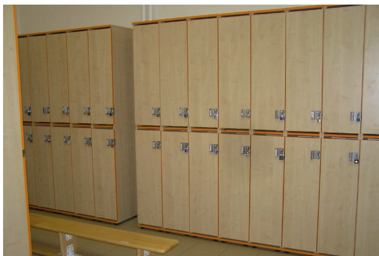
Šatna na II. st. ZŠ