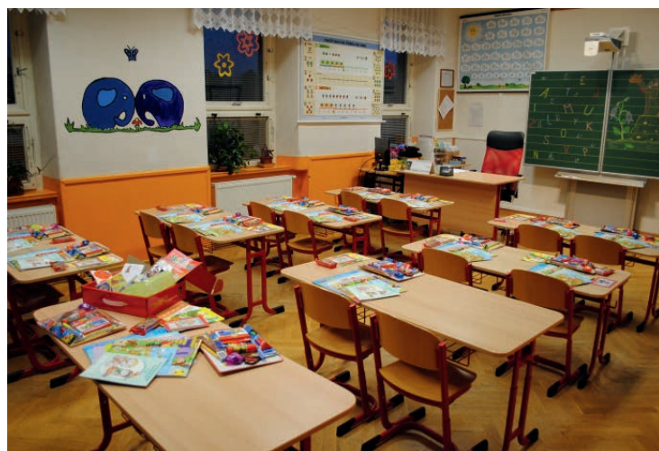
Učebna na I. stupni ZŠ s interaktivním triptychem