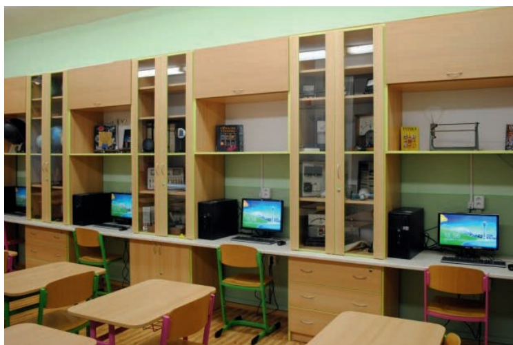
Multimediální učebna s PC