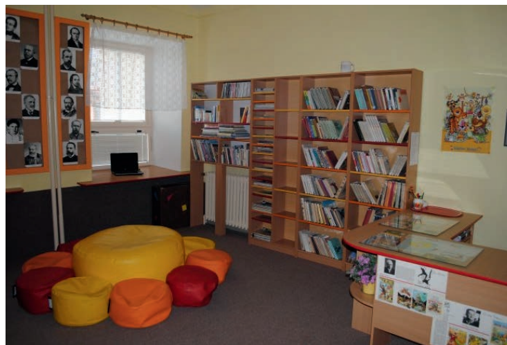
Knihovna, relaxační místnost